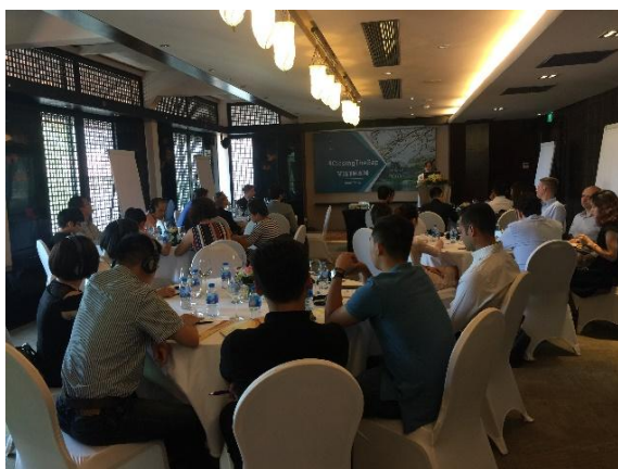
Hình 1: Phát biểu khai mạc hội thảo tại Hà Nội

Vào ngày 15 và 17 tháng 5 năm 2018, các bên liên quan từ Hệ sinh thái doanh nghiệp Việt Nam tham dự hai hội thảo tại Hà Nội và Thành phố Hồ Chí Minh để chia sẻ những điểm mạnh và điểm yếu của hệ sinh thái và cùng xây dựng các giải pháp tiềm năng đóng góp vào một môi trường hoạt động thuận lợi hơn cho các doanh nghiệp địa phương và công việc kinh doanh của họ. Hơn 65 đại diện từ các tổ chức tài chính, hiệp hội doanh nghiệp, tổ chức phát triển, chính phủ, trung tâm cung cấp dịch vụ hỗ trợ kinh doanh, các đơn vị giáo dục, doanh nghiệp và doanh nhân đã tham gia các sự kiện.