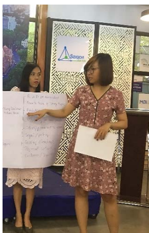
Hình 3: Người tham dự tại TP HCM trình bày các giải pháp

Các doanh nghiệp địa phương từ mọi lĩnh vực đều nhận thấy nhu cầu tăng ‘khả năng kinh doanh’ của họ, hạn chế chính trong phát triển doanh nghiệp. Các doanh nghiệp đồng tình về yêu cầu hỗ trợ thêm trong hoạt động kinh doanh, lập kế hoạch chiến lược cũng như tài chính.