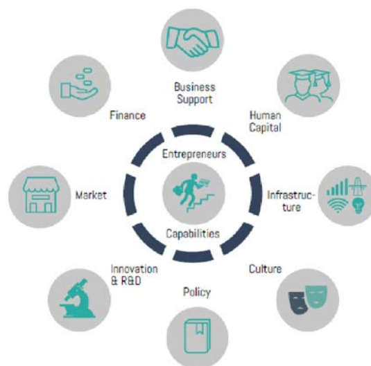
Hình 2: Khung hệ sinh thái doanh nghiệp đầy đủ

chưa được hỗ trợ tài chính, yếu tố cần thiết để các doanh nghiệp này phát triển. Định nghĩa "phần giữa còn thiếu" là những doanh nghiệp có tài chính vì mô phát triển nhưng chưa có cách tiếp cận các dịch vụ tài chính thông thường. DGGF / tổ chức tài trợ cho các DNNVV địa phương là "quỹ tài trợ" có thể đầu tư vào các quỹ và các tổ chức tài chính, từ đó tài trợ cho các doanh nghiệp địa phương tại 68 quốc gia, trong đó có Việt Nam. Loạt sự kiện #ClosingTheGap của DGGF được đề ra để cải thiện sự hiểu biết chung về những thách thức chính mà "phần giữa còn thiếu" phải đối mặt bằng cách nghiên cứu đặc điểm và nhu cầu của các doanh nhân địa phương; các giả định thử nghiệm liên quan đến việc cung cấp dịch vụ tài chính và phi tài chính hiện tại, chia sẻ những hiểu biết về tác động của chúng lên tính đa dạng của hệ sinh thái tổng thể. Phương pháp này đã được thử nghiệm ở Kenya vào năm 2015 và thu nhỏ ở cấp độ khu vực ở Tổ chức Quốc tế của các quốc gia nói tiếng Pháp Tây Phi vào năm 2017 bằng cách sử dụng khuôn khổ Mạng lưới các Doanh nghiệp Phát triển Aspen để đánh giá hệ sinh thái. Khuôn khổ này đã được sửa đổi cho #ClosingTheGap Mekong bằng cách thêm khả năng của các doanh nghiệp tại trung tâm.